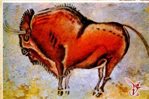
рисунки урочища Тамгал